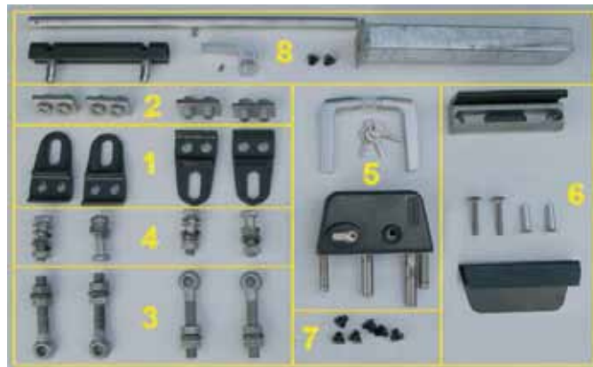
Zubehörset Tor 2-flügelig

Führen Sie die folgenden Schritte zur Montage des Zubehörs durch: