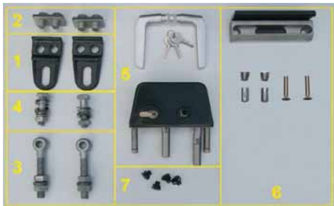
Zubehörset Tür 1-flügelig

Zum Lieferumfang eines Industrietores gehört ein umfangreiches Zubehörpaket mit hochwertigen Komponenten.